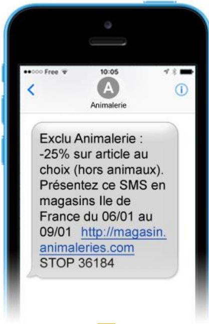
Réception du SMS