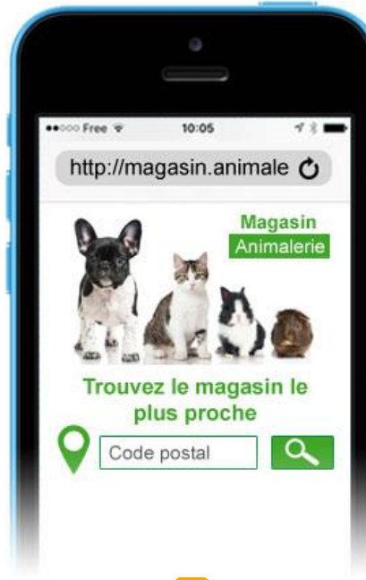
Géolocalisation du magasin le plus proche